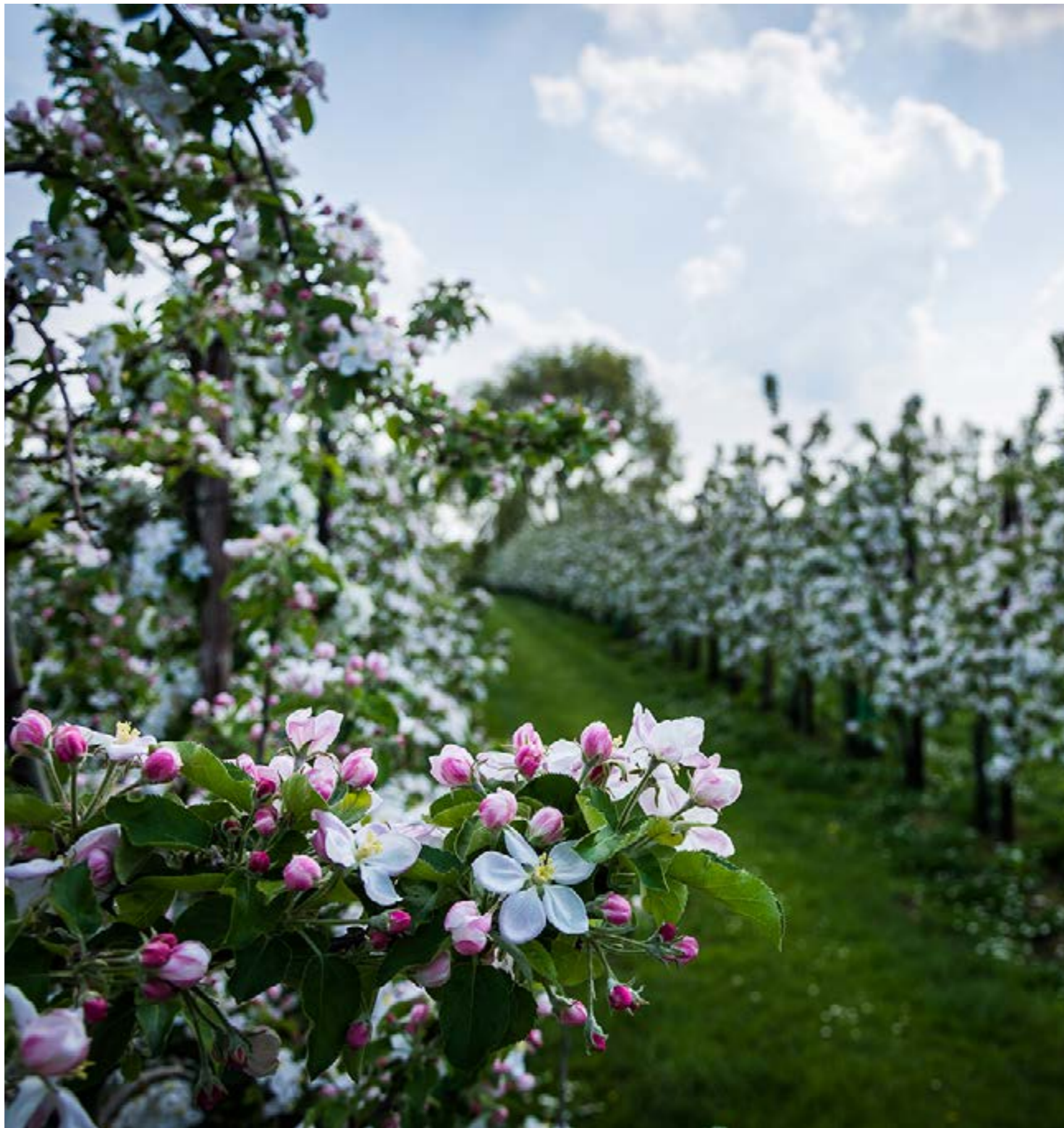
We zijn klaar voor de bloesems tijdens het Bloesem Beleef Bal.

www.instagram.com/gemeentesintgilliswaas