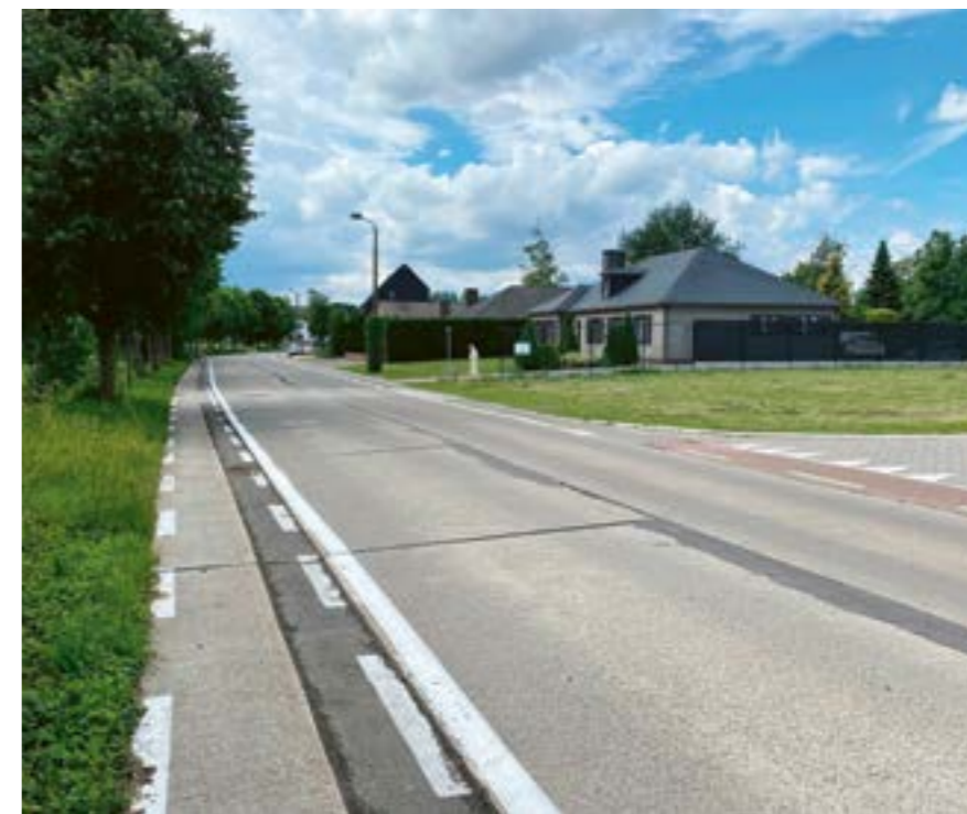
Het huidige fietspad in de Hogenakkerstraat

werden midden januari afgetoetst met de bewoners van De Klinge. Momenteel bekijken we al deze opmerkingen en suggesties verder met het studie bureau om zo tot een definitief ontwerp te komen. De wijziging in de Bergstraat, n.a.v. de omleiding, voerden we al uit. De heraanleg van de Hogenakkerstraat staat eind dit jaar gepland.