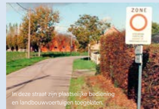
In deze straat zijn plaatselijke bediening en landbouwvoertuigen toegelaten.

Ben je geen plaatselijk verkeer en rijd je toch de straat in, dan riskeer je een boete.