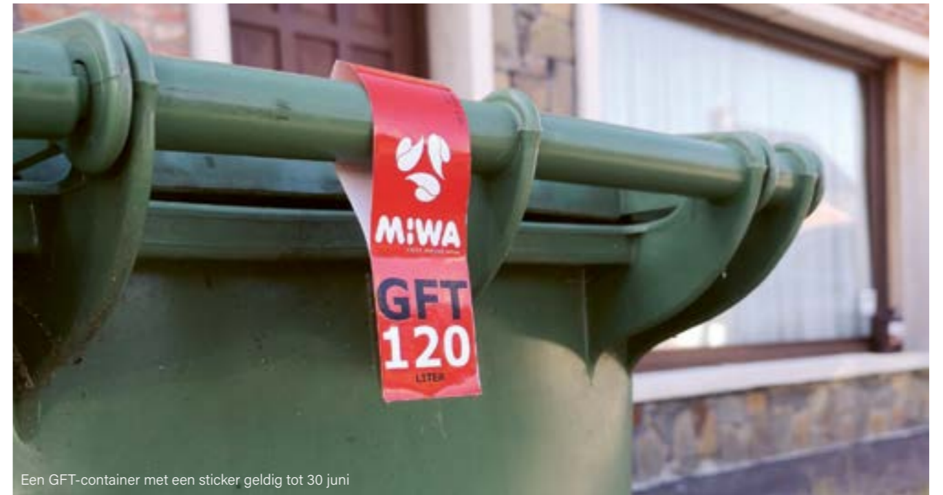
Een GFT-container met een sticker geldig tot 30 juni

Voor vragen over of hulp bij het digitaal aanmelden kan je terecht bij de dienst Onderwijs, 03 727 17 00, onderwijs@sint-gillis-waas.be